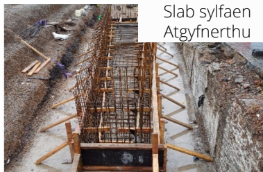
Slab sylfaen Atgyfnerthu