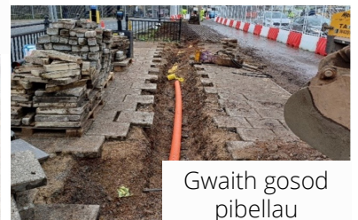
Gwaith gosod pibellau